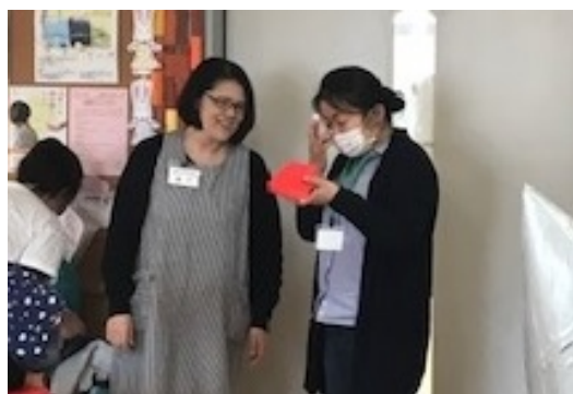
ひろばで子育て支援アドバイザーに相談