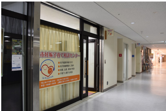
柏駅前妊娠子育て相談センター