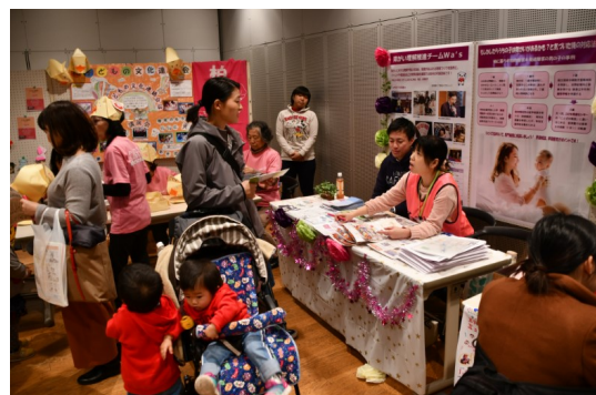
市民活動団体ブースのにぎわい