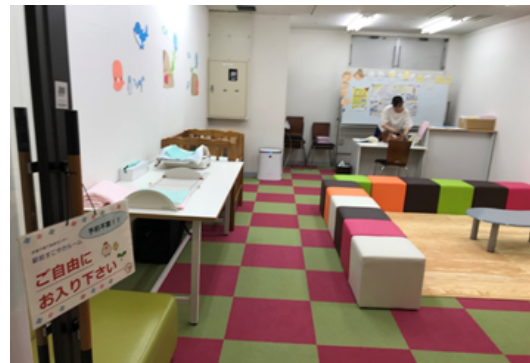
駅前すこやかプチルーム