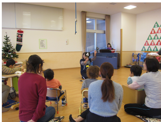
キッズルームの療育のようす

民間の療育機関については増加の傾向にあります。児童発達支援事業所連絡会を活用し、官民の児童発達支援センターが中心となって、事業所間のネットワーク作りや研修会の実施等により、市全体における療育の質の向上に努めていきます。