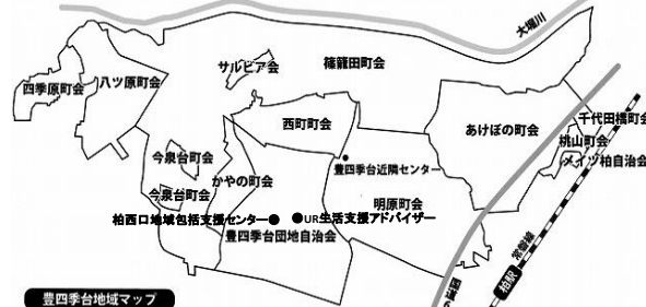
豊四季台地域マップ

昔は、豊四季台団地あたりは競馬場で、周囲もほとんどが山林と農地でしたが、昭和30年代後半以降開発が進み、多くの住宅が建築されるようになり、現在のような街が