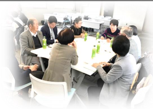
(実行委員会の様子)