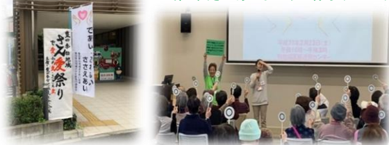
第3回さんあいまつりの様子(2019.2)

ふるさと協議会、町会・自治会、民生委員・児童委員、健康づくり推進員、柏西口地域包括支援センター、社会福祉協議会、UR都市機構、東大など