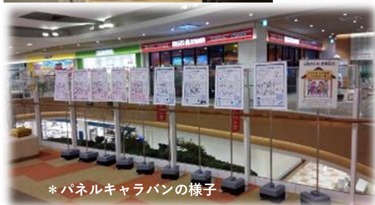
* パネルキャラバンの様子