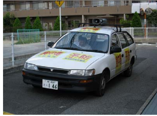
食中毒予防キャンペーン