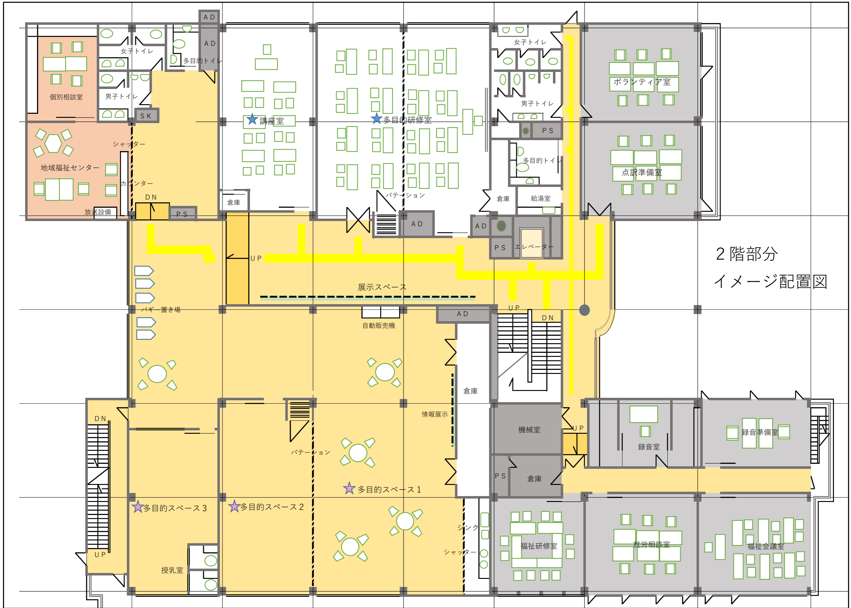
2階部分 イメージ配置図