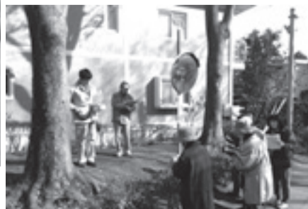
▲モニタリング測定の様子