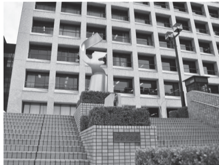
▲本庁舎南側玄関前階段にある平和祈念碑

世界の恒久平和と繁栄を祈るシンボルとして昭和61年に建立しました。碑の上部は、力強く大空を羽ばたく「鳩=平和」を、下部は、御影石2枚で「合掌=祈り」を表現しています。御影石は、広島市から寄贈された旧広島市庁舎の被爆石を用いています。