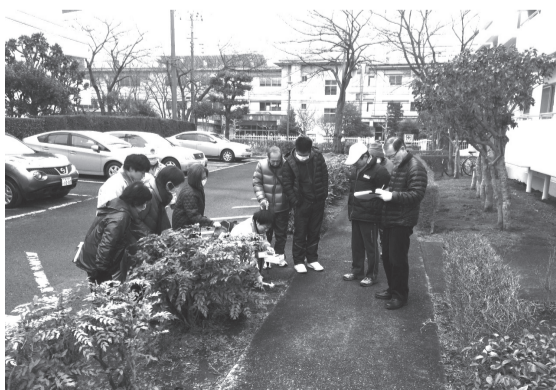
▲放射線量率測定の様子

町会、自治会等やご近所のかたなど少人数グループが行う測定や除染作業を支援します。また、除染作業後の放射線量率測定の支援も行っていますので、ご相談ください。