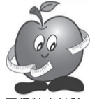
柏市国保特定健診 マスコット「はかる君」