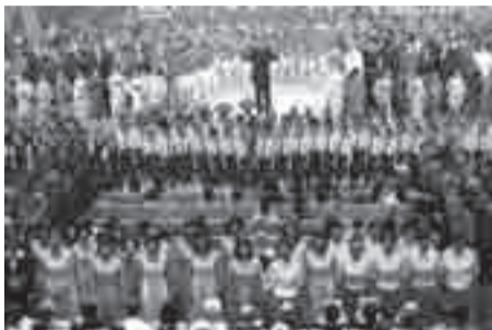
▲昨年のかしわ市民芸術祭のフィナーレ