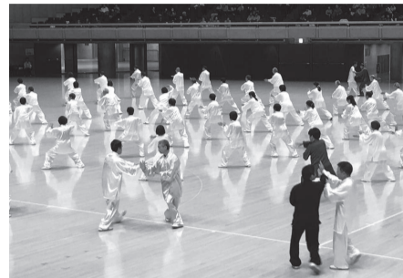
▲太極拳実技講習会の様子