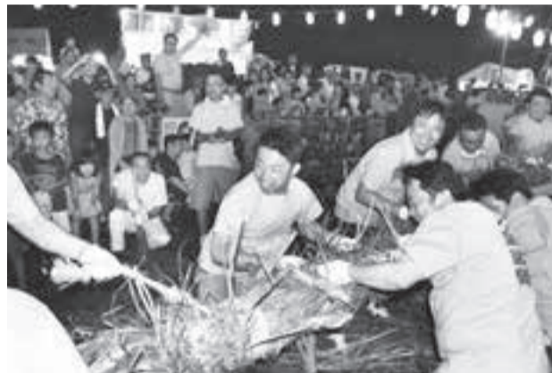
▲威勢の良い掛け声と共に、綱を引き合います

🚶 ▶柏たなか駅から徒歩20分 ▶柏駅西口から柏市立高校・柏たなか駅行きバスで「大室」下車、徒歩10分