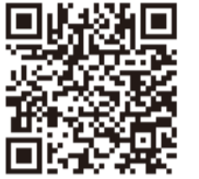
▲応募用紙はこちら

☎他応募作品は返却しません。採用作品の権利は市に帰属します※手直しをする場合あり。応募用紙は、市のホームページからダウンロード可。詳しくは市のホームページを見るか問い合わせを