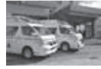
▲東部消防署の救急車が2台に

平成28年の救急出場件数は過去最多の18,372件で、1日当たり約50件、およそ30分に1回出場しています。また、搬送された人数も過去最多の17,217人でした。