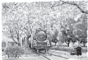
▲柏西口第一公園の機関車と桜

価 300円 販売開始 / 11月2日(水)午前9時から 販売場所 / 柏市観光協会(柏商工会議所内)、かしわインフォメーションセンター(柏駅南口ファミリかしわ3階) 発行部数 / 2,000部