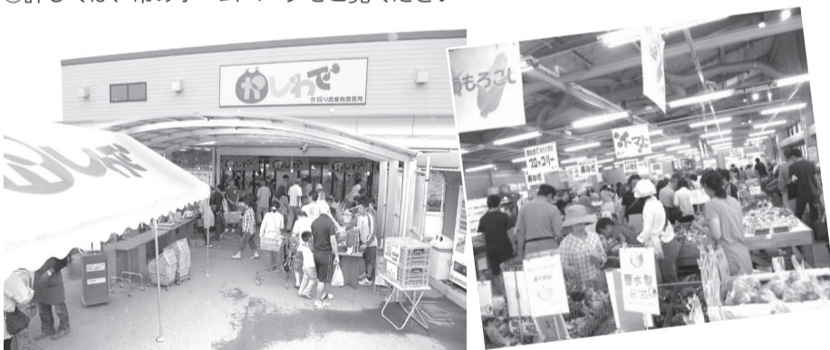
▲来春、農家レストランをオープンする予定の「かしわで」