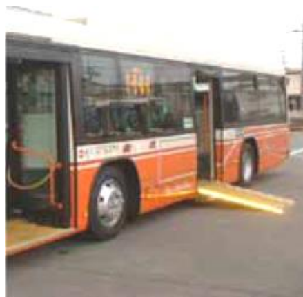
■ノンステップバス車両