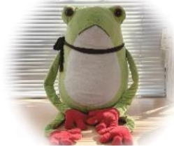
マスコットの かしこちゃん

4月の予約は、 4月3日(水) から受付けます。 子育て支援センターおいかけっこでもお受けいたします。 時間:10:00～16:30