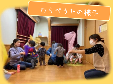
わらべうたの様子