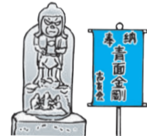
▲庚申塔。地図では右のマークが目印

藤心にある県道280号の交差点には、かつて逆井・藤心・高柳の村境に立てられた道しるべがあります。南側に記された「ぎょうとく」への道は、当時の村人たちが塩どっけに使っていたので「塩の道」と呼ばれ、塚崎神明社まで続く道には青面金剛立像が彫られた庚申(こうしん)塔が立てられています。