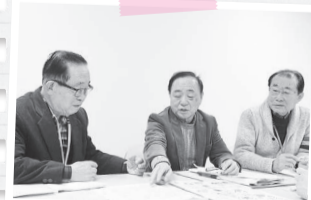
◎連動企画「フレイル予防ウォーキング」を開催。詳しくは、本紙8面で確認を

現在、南部近隣センターはリノベーション工事中のため利用できませんが、来年春ごろから利用再開する予定です。どのような施設に生まれ変わるのか、今から楽しみです。