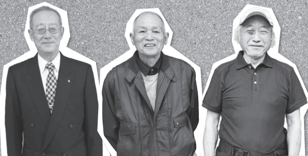
教えていただいた皆さん