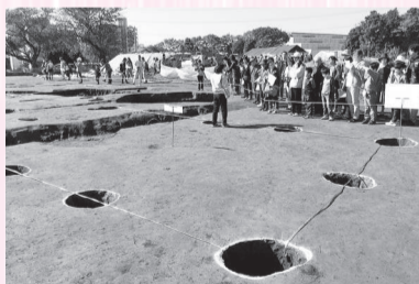
▲昨年行われた現地説明会の様子(花戸原遺跡)