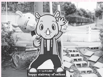
さかサイ君も記念に1枚

逆井と言えば「さかサイ君」！地名をもじった黄色いサイをご存じですか？「さかサイ君の幸せの階段」とさかサイ君パネルは「遠方から来るさかサイ君ファンが、いつでもさかサイ君に会えるように」という思いから作られたそうです。