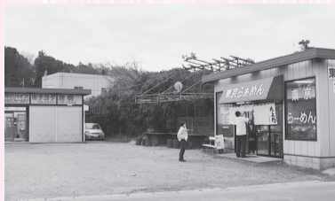
プレハブ小屋に青の看板が目印

砂利の駐車場に建設現場の事務所のような建物…。実はここ、ラーメン屋さんなんです。18年前は建築資材の会社でしたが、先代のラーメン好きが高じて敷地内にお店をオープン。その後、会社はたたみましたが、元社屋は家族向けのテーブル席として利用しています。