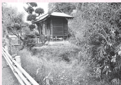
▲神社の周りのくぼみが足跡