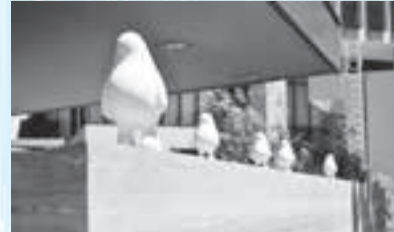
この「かげもじゃ」 実はいろんな ところにいます▶

柏の葉の街にはいくつものアート作品がちりばめられています。公園周りや駅周辺を散策しながら「こんなところにもある!」という発見を楽しんでみてはいかがでしょうか。