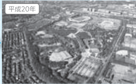
▲園内にはさまざまな施設があります ◀戦後米軍の通信所となった飛行場跡