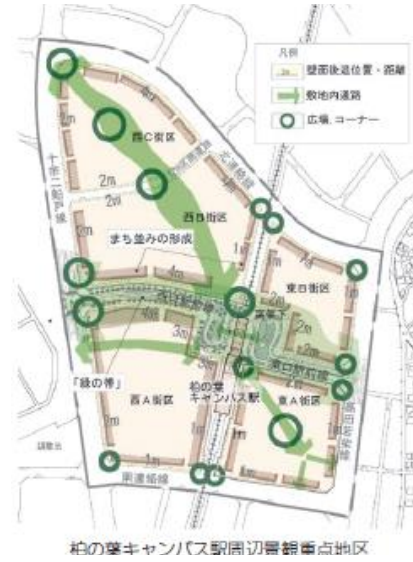
柏の葉キャンパス駅周辺緑化重点地区