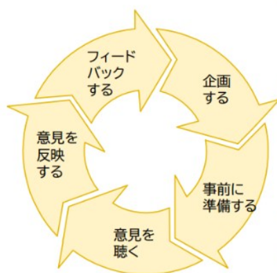
意見反映プロセスの全体像 1)