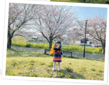
大堀川 リバーサイドパーク