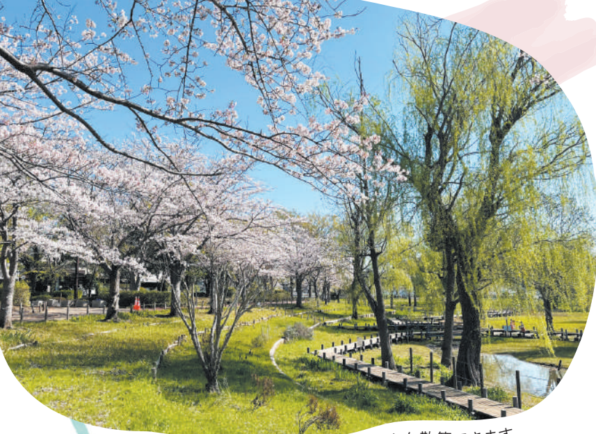
桜を楽しみながら園路を散歩できます