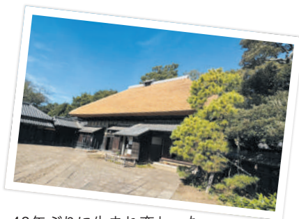
40年ぶりに生まれ変わった 主屋のかやぶき屋根