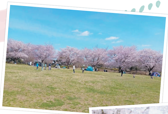
中原ふれあい防災公園