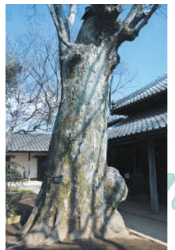
門をくぐると、樹齢200年以上のケヤキが左右にどっしりと力強く構えています