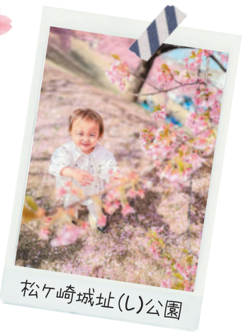
松ヶ崎城址(し)公園