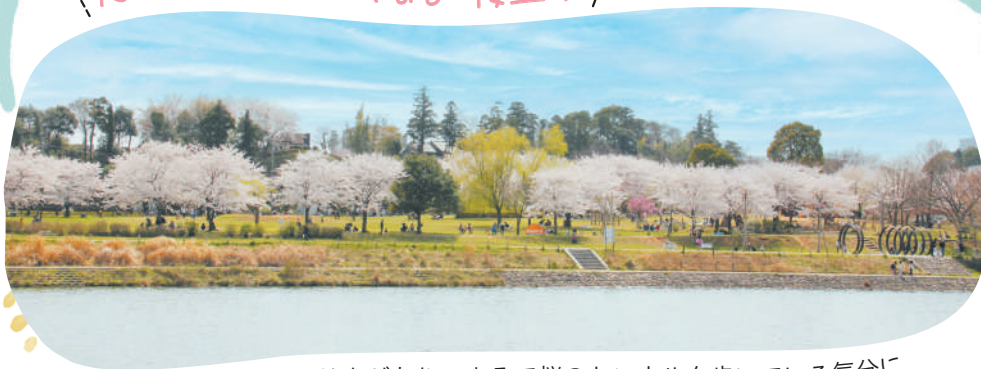
公園内の歩道には桜並木があり、まるで桜のトンネルを歩いている気分