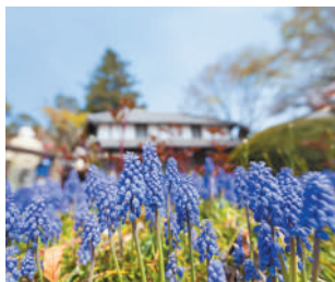
園内の花壇にあるムスカリの花。 4月上旬ごろまで見ることができます

江戸時代に建築された国指定の重要文化財で、まるでタイムスリップしたかのような趣を感じられます。風格ある門の脇には、時代を超えて咲き続ける桜の木もあり、四季の移ろいとともに歴史を感じる時間は格別です。