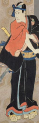
「江戸の嶋もち」部分