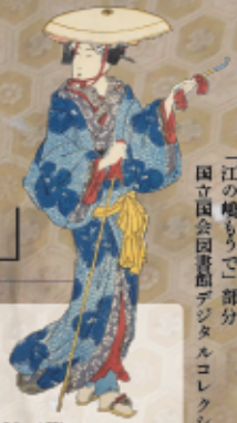
「江戸の嶋もち」部分