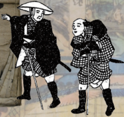
千ヶ寺一宿日記 (天保7年) 中村浅吉編『弥次郎喜多八藤栗毛』