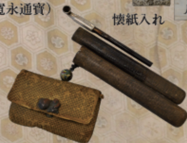
きせるとたばこ入れ