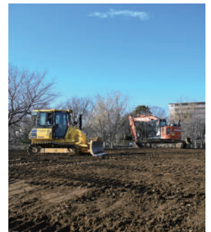
頑丈な鋼の板を沼に打ち込みます 設置場所の土をならします

さらに、園路は段差のないスロープを設置するなどバリアフリー対応のアスファルト舗装となり、多くのかたがより安心して散歩できる空間になります。ウッドデッキ脇の階段を利用すれば、そのまま手賀沼につながるようになるため、音楽などのイベントだけでなく、サップなど水辺ならではのアクティビティの拠点としてもにぎわいそうです。