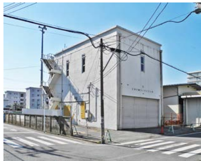
訓練棟正面と東側面

お祝い会では、国登録有形文化財への登録答申を記念し、建物の歴史についての講演会や、地元高野台にお住まいの方による座談会を行います。