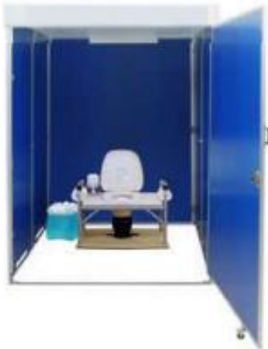
マンホールトイレ

避難所の衛生環境の向上のために、下水道が整備されている小中学校にマンホールトイレを引き続き整備する。令和8年度で整備が完了する。