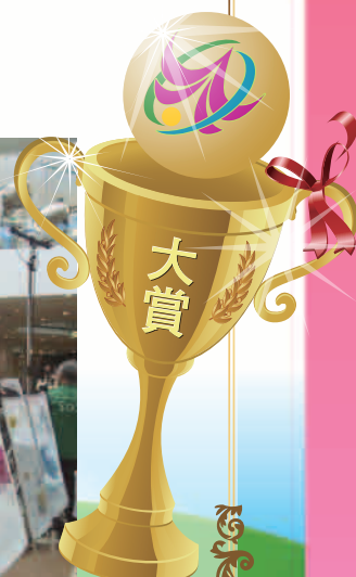
表彰式（かしわ環境フェスタ2014）