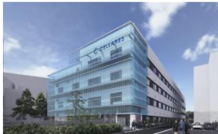
▲ 新施設外観のイメージパース

がん再生医療等製品の開発製造に関する革新的な技術を有する米国企業Cellares Corporation(セラレス コーポレーション)が開発拠点及び日本法人であるセラレス・ジャパンの立地を柏の葉地区に決定。