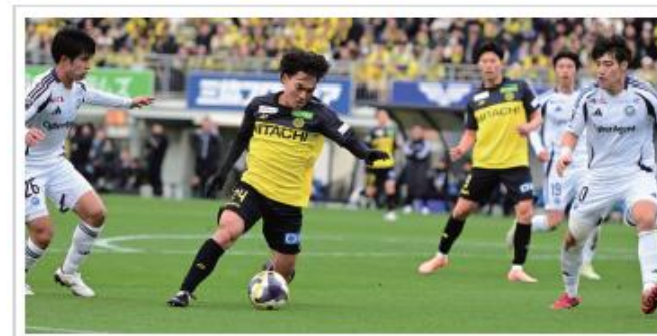
▶ 柏レイソル最終戦

14年ぶりの優勝をかけた運命の最終戦で勝利をするも、惜しくも準優勝。三小ではパブリックビューイングを実施し応援を行った。