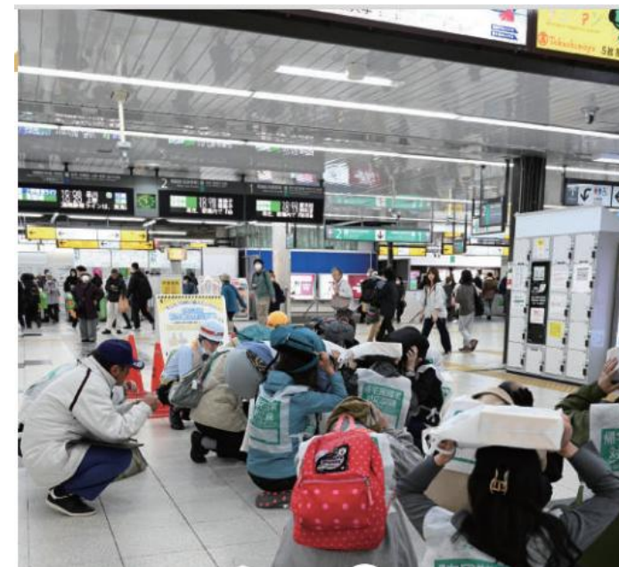
▲ 総合防災訓練の様子

1907年に創業し日本の産業を支えてきた日本製鋼所が、革新技術や新領域へ挑戦するための研究開発拠点の立地を柏の葉地区に選定。