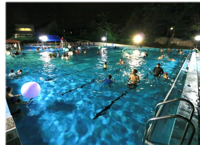
▲ ナイトプールの様子

連日の猛暑や水温の上昇する中で、市民プールの夜間開放を実施。柏西口第一公園の市民プールと、逆井市民プールの2施設で、夏休み期間中の、土・日・祝日の7日間を開放。