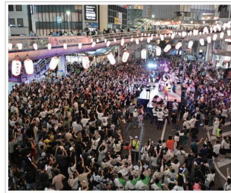
▲ 西口ステージの様子