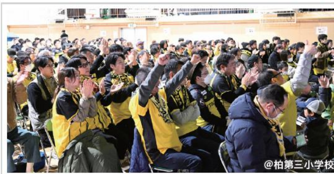
▶ パブリックビューイングの様子

令和6年12月に、本の広場、中高生の広場がオープンし、子ども・子育て支援複合施設TeToTeの全フロアがオープン。乳幼児から中高生世代まで広く利用されている。