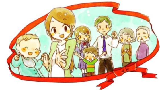
柏市母子保健計画