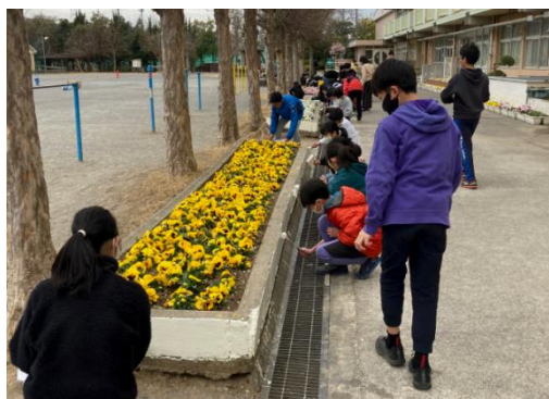
写真11 地域学校協働活動の様子