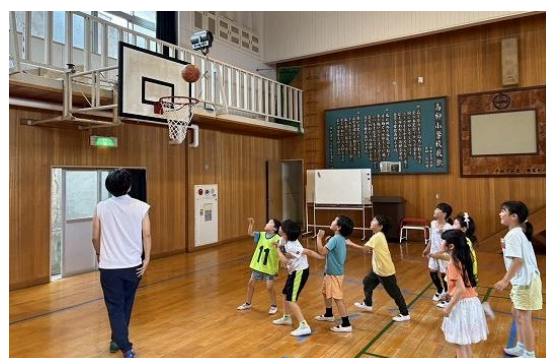
写真12 アフタースクールの活動の様子