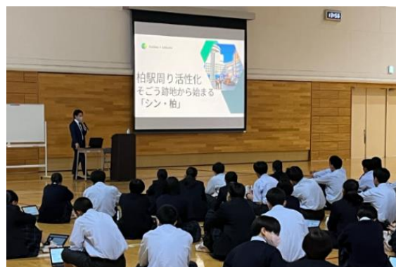
生徒に向けた説明会