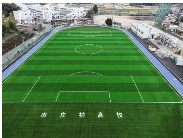
写真10 市立柏高等学校の人工芝グラウンド