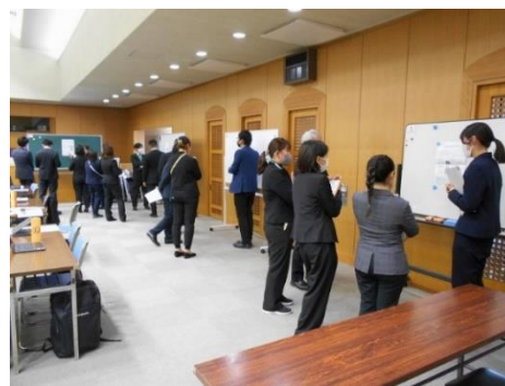
写真9 教職員の年次経験者研修