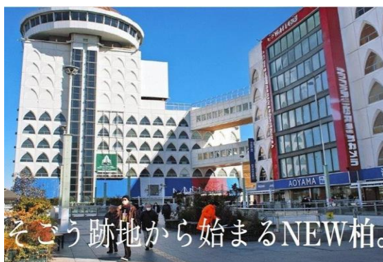
令和6年度生徒発表作品

生徒たちはSDGsの視点を取り入れ、環境や福祉など持続可能な社会づくりを意識した提案に挑戦しました。この活動は、次世代の地域リーダー育成に向けた大きな一歩となっています。