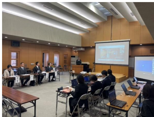
写真8 いじめ防止サミット KASHIWA