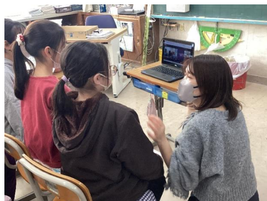
写真5 IT教育支援アドバイザーによる支援