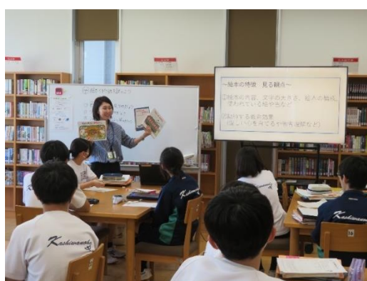
写真3 学校司書による読み聞かせ