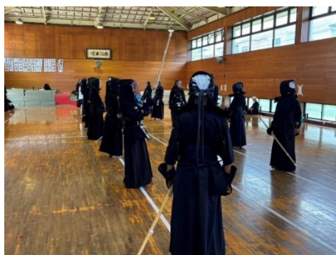
写真1 部活動の地域展開