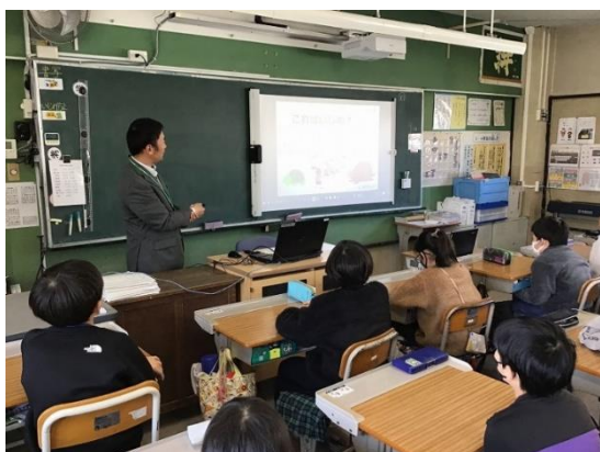
写真4 情報モラル出前授業の様子