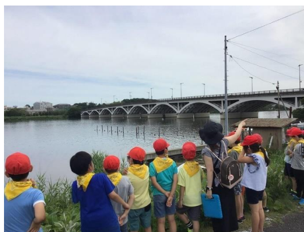
写真6 社会科の授業での地域学習