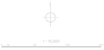
柏市都市計画図（令和6年4月）を加工して作成