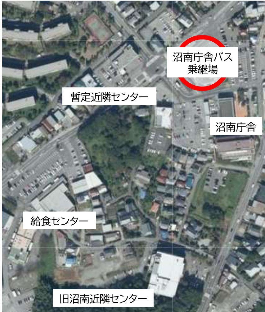
地理院地図(電子国土WEB)を加工して作成