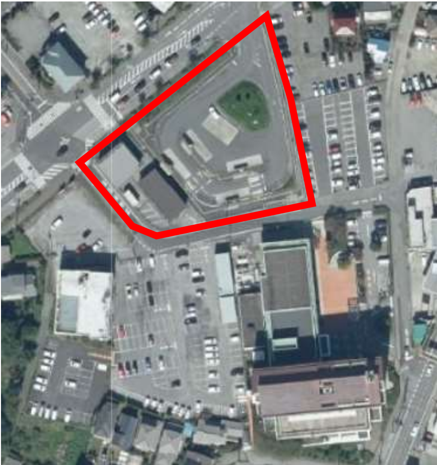
地理院地図(電子国土WEB)を加工して作成

近隣センターを整備する候補地を 沼南庁舎バス乗継場とすることについて ご意見を伺います。