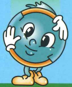
クリンちゃん 柏市ごみ減量マスコットキャラクター