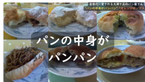
【柏市立大津ヶ丘第一小】ふるさとPR映像④「パン屋・オレンジポップス編」