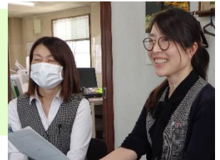
様々な取組を企画されている総務部のおふたり

総務担当者が従業員の意見や反応を見ながら、日常的に行うもの・イベント等を企画しています。様々な取組を行う中で、参加者も増え、 共通の話題 が出来たことで社内で 一体感 が生まれたと思います。また、健康増進の効果はすぐには現れませんが、従業員の 健康意識 は高まったと思います。