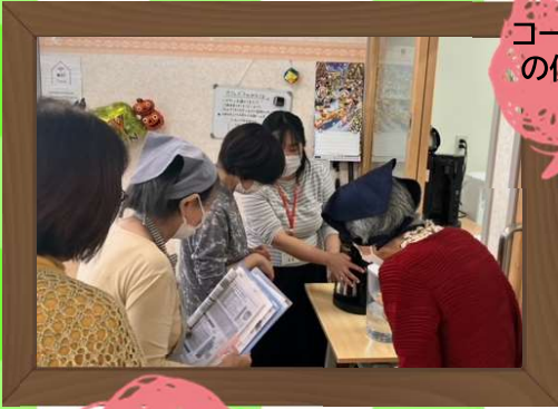
コーヒーマーカーの使いかたです