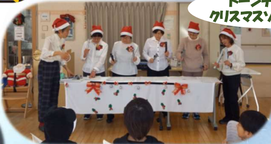
トーンチャイムで クリスマスソング演奏♪