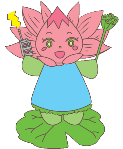
柏市上下水道局キャラクター