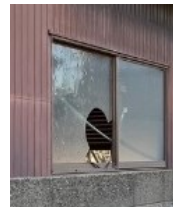
窓が割れた 管理不全空家