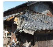
緊急代執行を要する 崩落しかけた屋根