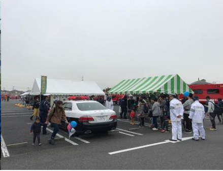
パトカー乗車体験