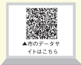
▲市のデータサイトはこちら