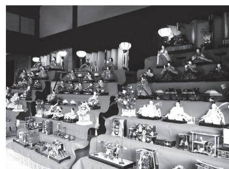
▲七段飾りのひな人形