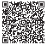
▲市のホームページはこちら