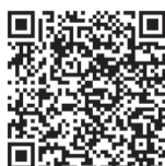
▲市のホームページはこちら